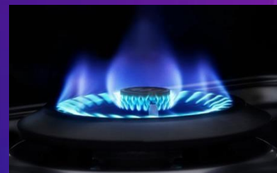
• Quemador Triple Llama