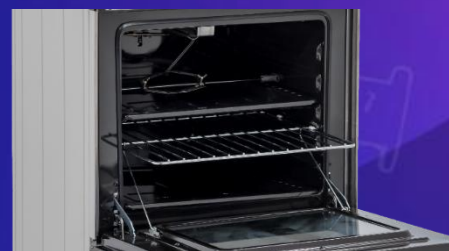
• Grill dorador