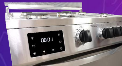
• Pantalla digital