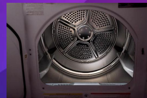
• Espacio de carga