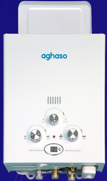
Terma de 5.5 Litros