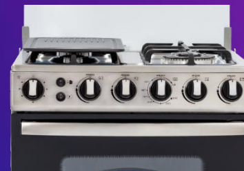
• Quemador triple llama