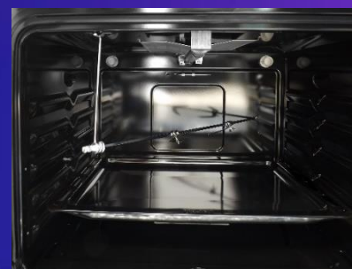
• Horno con Rosticero