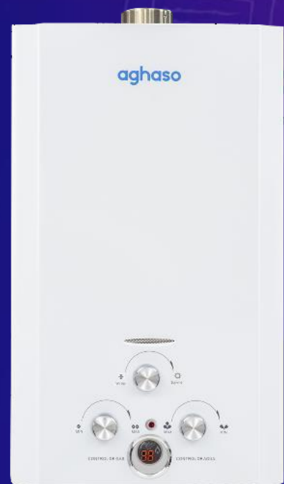
Terma 10L Tiro Forzado