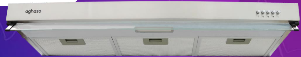
Campana extractora 90 cm