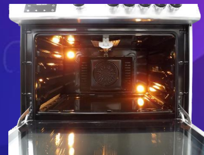
• Horno con Rosticero giratorio